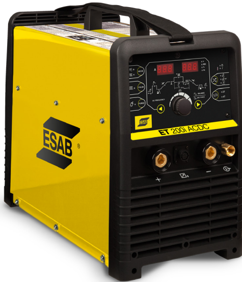
ET 200i AC/DC

La ET200i AC/DC es una máquina completa, con todos los recursos para soldadura TIG y Electrodo.